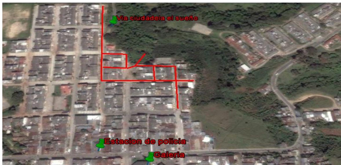
Esquema 2. Localización de las redes en el municipio de Quimbaya.