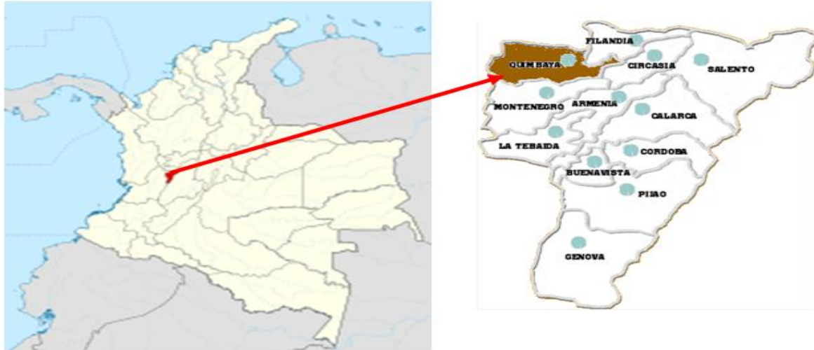
Esquema 1. Ubicación del Departamento del Quindío en el País y el Mpio. en el Dpto.