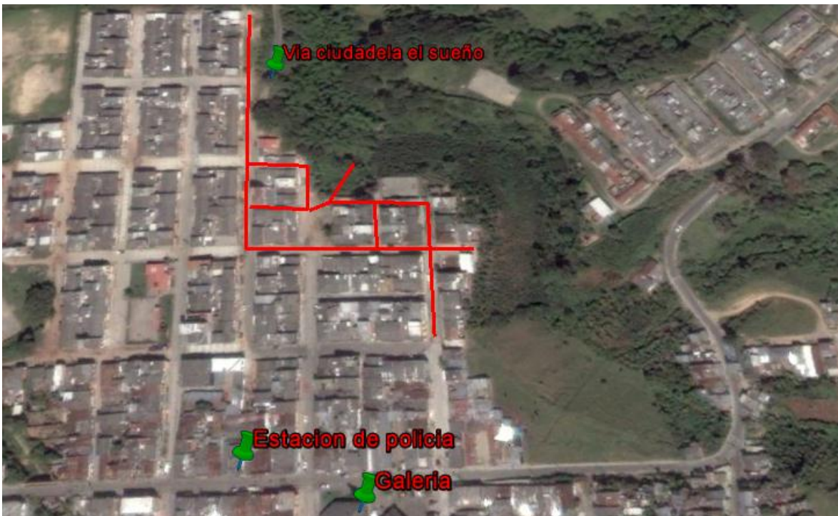
Esquema 2. Localizacion de las redes en el municipio de Quimbaya.