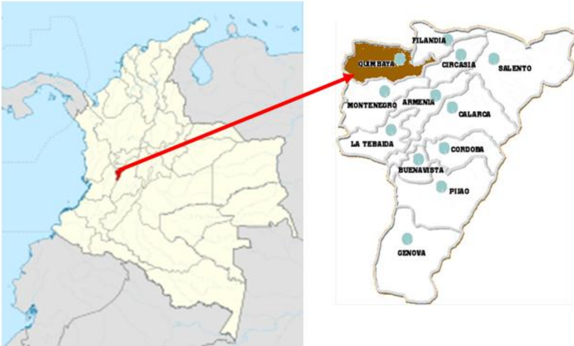
Esquema 1. Ubicación del Departamento del Quindío en el País y el Mcpio. en el Dpto.

Se presentan los mapas en esquema deductivo desde la localización del Departamento en el País, hasta los sectores a intervenir en el Municipio de Quimbaya.